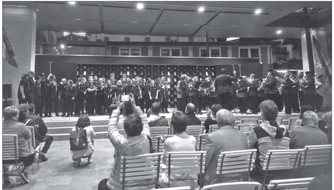
Die Jungmusikantinnen und Jungmusikanten werden gebührend gefeiert.

Es war bereits am Eindunkeln, da hörte man in der Ferne das Horn eines Cars. Das mussten wohl die jungen Meisterinnen und Meister sein. Die Musikantinnen und Musikanten der Feldmusik Weggis, der Greppermusik und der Musikgesellschaft Vitznau stellten sich zum Ständchen auf und warteten geduldig auf den Einmarsch der Sieger. Die Eltern und Fans standen am Strassenrand Spalier. Kaum aus dem Car ausgestiegen, hörte man auch schon das Jubeln – «Meischer, Schwiizer Meischer!». Die Jungmusikantinnen und -musikanten marschierten Arm in Arm und mit strahlenden Gesichtern zur Schiffstation. Der Musikcorps aller drei Seegemeinden spielte einen rassigen Marsch und begrüßte die Jungen. Nach kurzer Prozession zum Pavillon, stellten sich die Jungmusikantinnen und -musikanten auf der Bühne auf und liessen sich von allen feiern. Walter Röllin von der Feldmusik